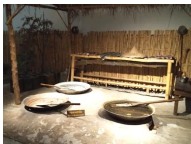
展示②: アヘンを煮詰めるための鍋