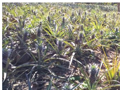
パイナップルはチェンライの特産品