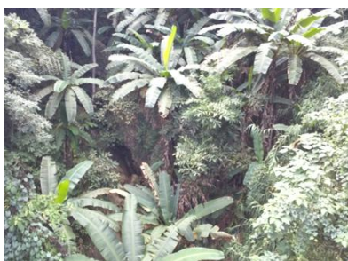
キャノピーウォークから見たバナナ