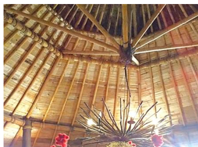
夕食で訪れた竹材の建物