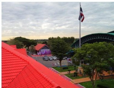
広々とした緑豊かなキャンパス