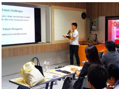
「竹魚礁」について英語で発表