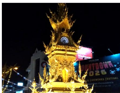
チェンライの金色の時計塔