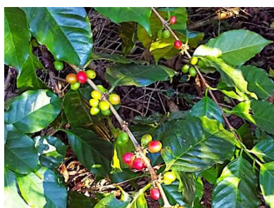
コーヒーチェリーと呼ばれる赤い実