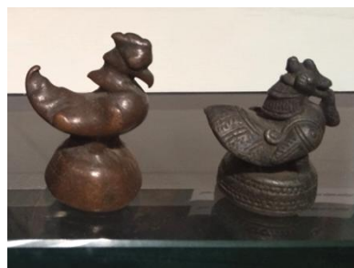
展示③: アヘンの重量を測る錘