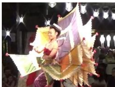
カントークディナーで孔雀踊り