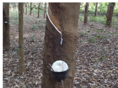
タイは世界最大の天然ゴム生産国