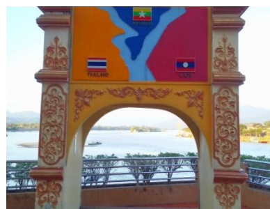
国境: 左にミャンマー、右にラオス