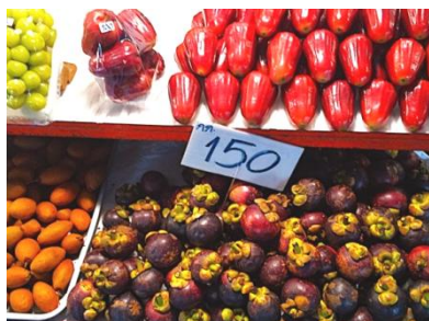
市場で売られている熱帯果実