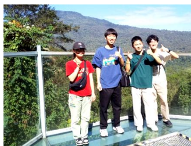
キャノピーウォークの終点