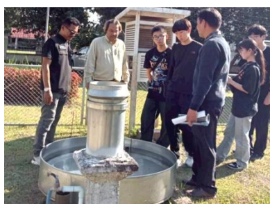
水文学と雨量計との関わり