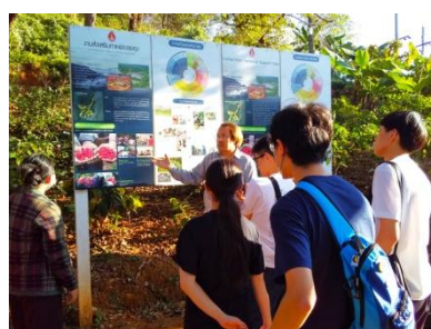
森林農法によるコーヒー栽培