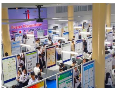
ポスタープレゼンの会場