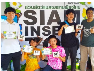
チョウの標本が完成