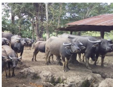
のどかなスイギュウ牧場