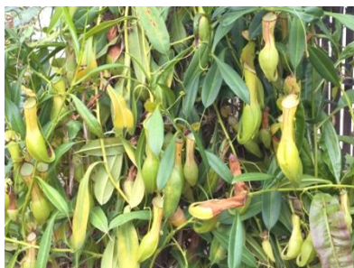
食虫植物ウツボカズラ