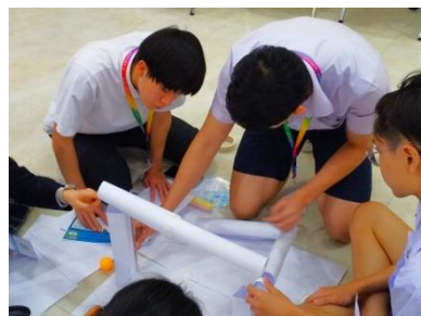
午後のサイエンスアクティビティ