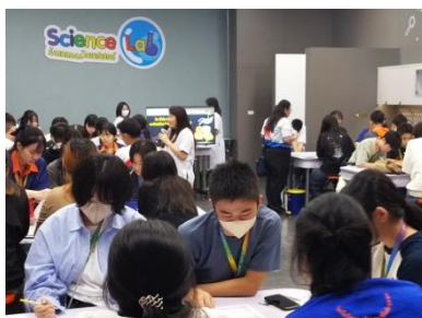
ラボでTJ協働の体験学習