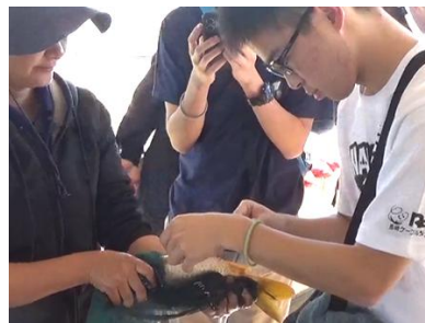
ホルモン注射に挑戦