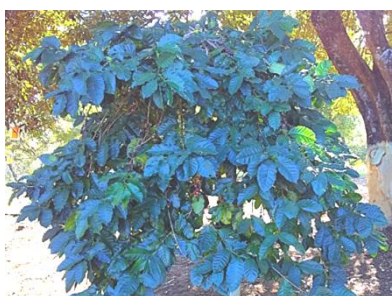
ドイトンコーヒーの原木