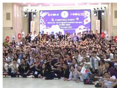
みんなが集まって記念撮影