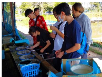
養殖についてじっくり観察