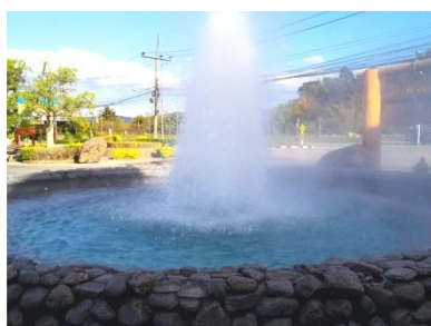
勢いよく噴き出す温泉