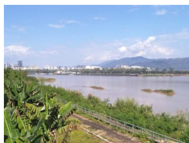
調査対象のメコン川、対岸はラオス