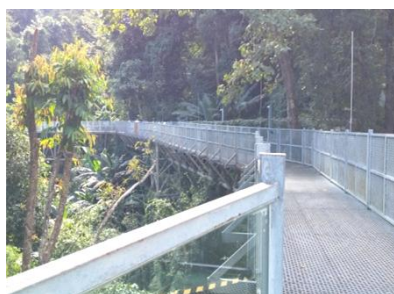
「キャノピー」＝「樹冠・林冠」