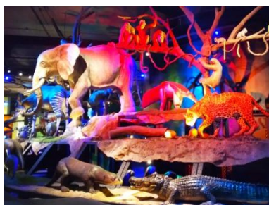
博物館で科学の学び