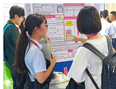
質問にもしっかりと対応