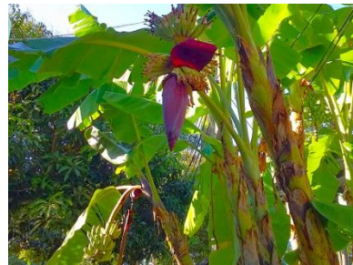
キャンパスの片隅で実るバナナ