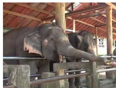
タイといえばゾウ