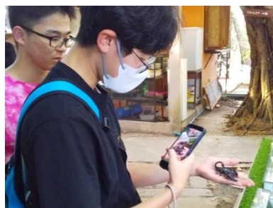
サソリを手に乗せて観察