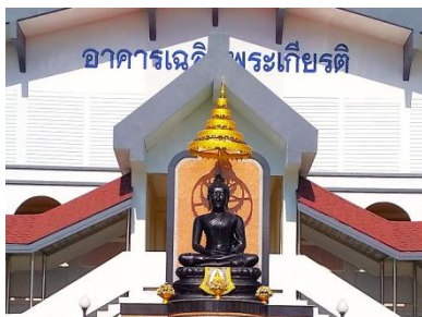
キャンパスの中心に仏様が鎮座