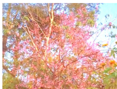
12月に開花するヒマラヤザクラ