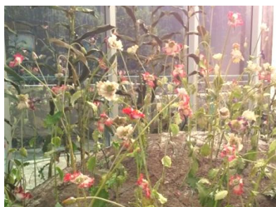
展示①: ケシ畑のレプリカ